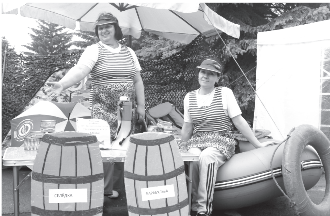
На фото: гостеприимная команда первомайских рыбаков

Первомайские любители рыбной ловли приняли участие в областном празднике День рыбака, проводимом в Пошехонском районе