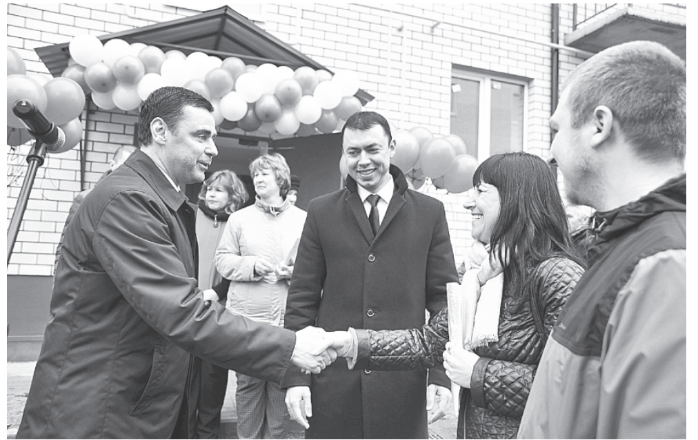
Вручение ключей в Тутаеве

Целенаправленная политика областной власти даёт результаты. В конце 2016 – начале 2017 года введены в эксплуатацию четыре долгостроя. 645 ярославцев получили долгожданное жильё. Ещё пять проблемных домов планируется ввести в эксплуатацию до конца текущего