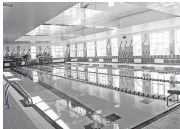
На фото: проект бассейна в п. Пречистое

области, страны. И не только сельское хозяйство. Но и коммунальное, страдаю-