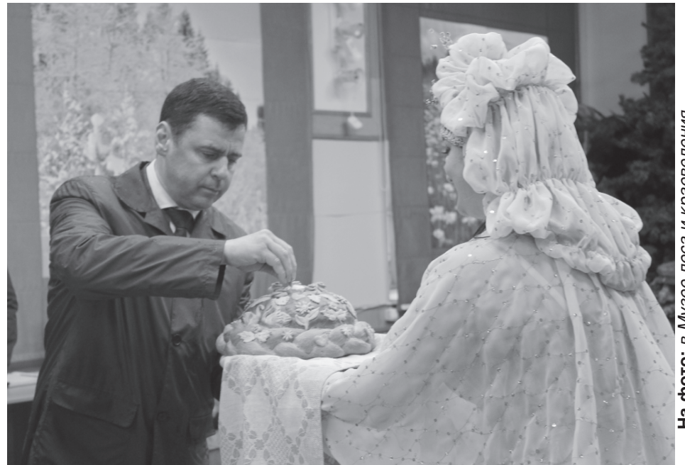
На фото: в Музее леса и краеведения

Бассейн планируется построить на участке около спорткомплекса «Надежда». Проектно-сметная документация уже готова, где предусмотрены чаша на 5 дорожек, тумбы для прыж-