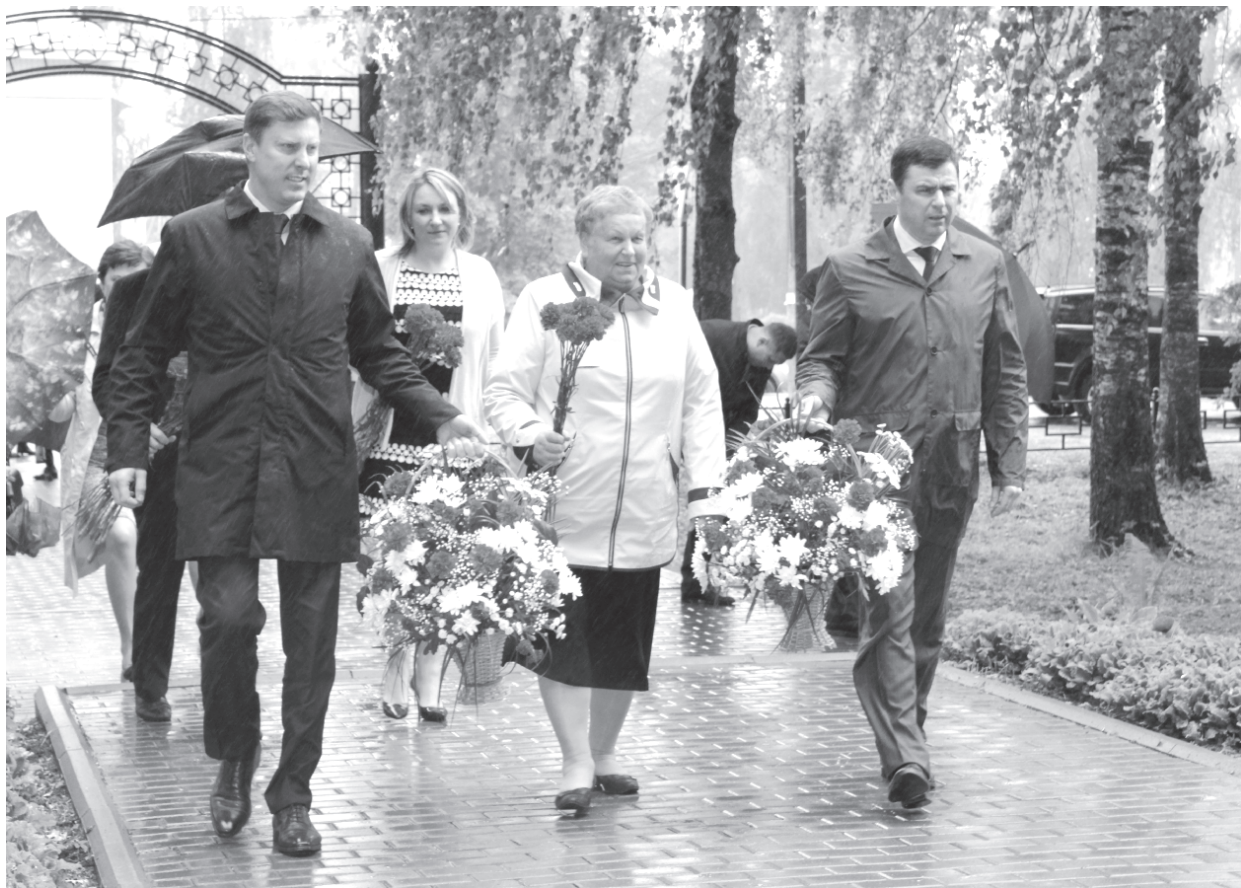
На фото: возложение цветов к памятнику павшим в Великой Отечественной войне. Парк Победы, п. Пречистое

Врио губернатора Ярославской области Дмитрий Миронов был назначен на должность еще летом 2016 г. Знакомство с муниципальными районами региона для Дмитрия Юрьевича стало первоочередной задачей. Вот и Первомайский муниципальный район распахнул свои гостеприимные северные ворота в минувший четверг.