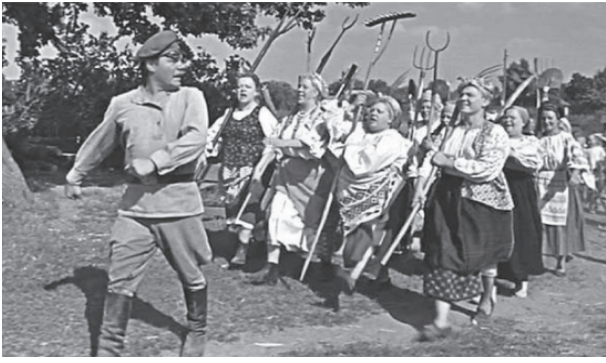
На фото: кадр из фильма «Свадьба в Малиновке»

Вряд ли ошибемся, если скажем, что весна – самое прекрасное время года. После зимней спячки пробуждается природа, а у человека поет душа, как в песне: «И тает лед, и сердце тает, и даже пень в апрельский день березкой снова стать мечтает». А тут и первый весенний праздник – Международный женский день 8 Марта подоспел.