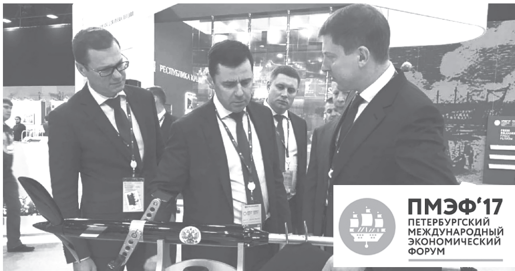
Делегация региона во главе с Дмитрием Мироновым

Не секрет, что при жёсткой конкуренции регионов на туристическом рынке, туристов можно привлечь только качественной инфраструктурой. На Петербургском форуме подписано соглашение с ОАО «Ярославский