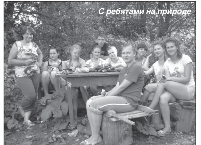
С ребятами на природе