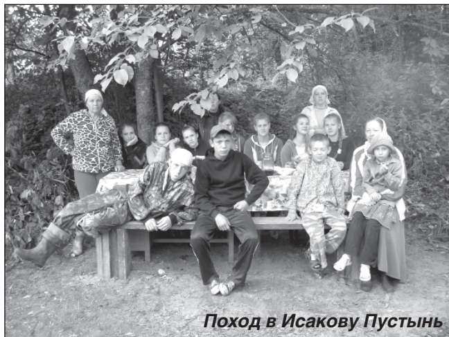
Поход в Исакову Пустынь

— Во все времена на селе учитель пользовался беспрекословным авторитетом, — делится своими мыслями моя собеседница. — Эта традиция и сейчас сохранена. Правда, с некоторым отличием от времен минувших: если раньше