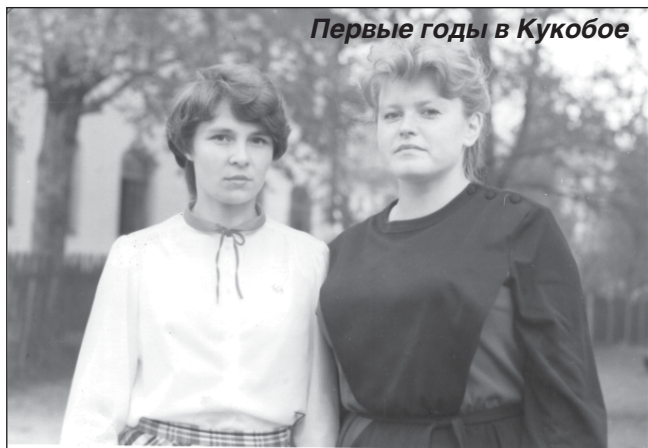
Первые годы в Кукобоя

важна как в жизни села, так и в жизни каждого обучающегося — известно давно. Сельские девчонки и мальчишки проводят в школе большую часть своего времени. Они идут в школу не только за знаниями и за общением, но и проводят здесь свой досуг. И роль