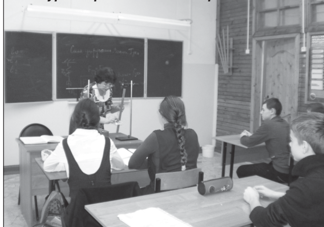
На уроке физики в МОУ Первомайской СОШ

во. Корабль почему-то к берегу не пристал: с него бросили на берег трехметровую доску, по которой я и сошла с корабля. Потом