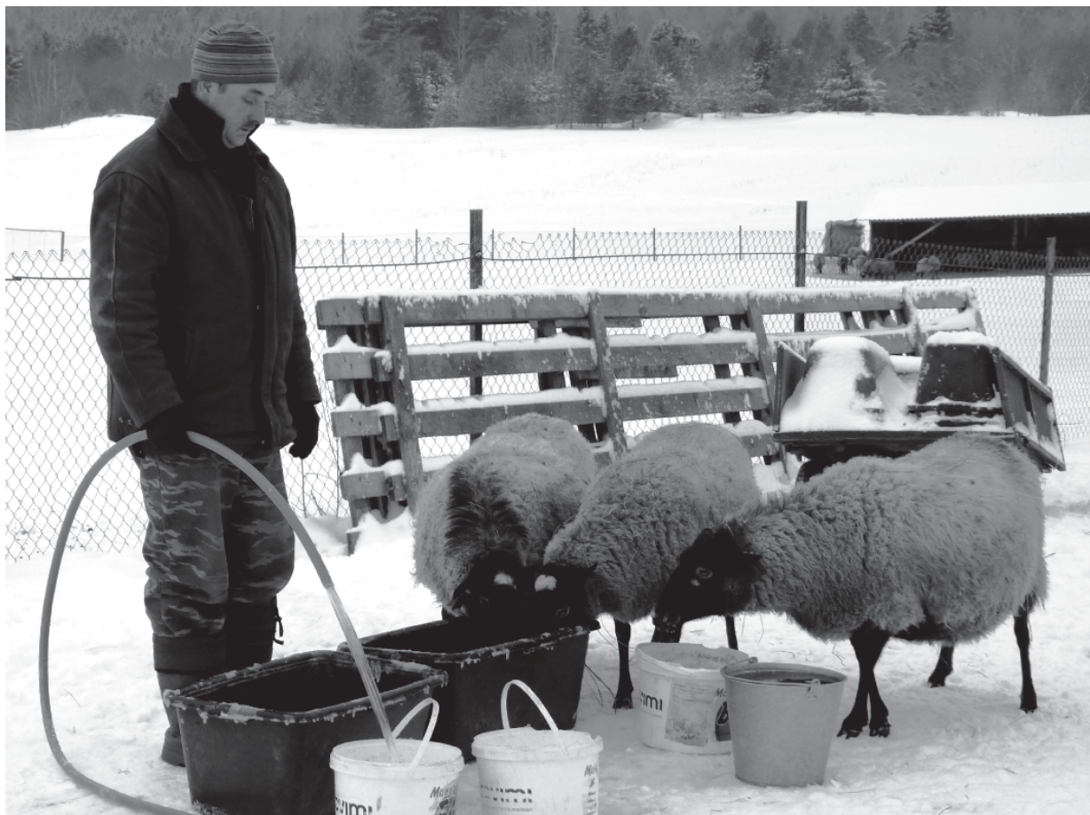
На фото: овцеферма в д. Юрьевское