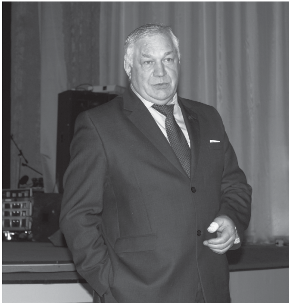
На фото: заместитель председателя Ярославской областной Думы В. В. Волончунас на встрече с первомайцами

В минувший четверг поселок Пречистое посетил заместитель председателя Ярославской областной Думы В. В. Волончунас.