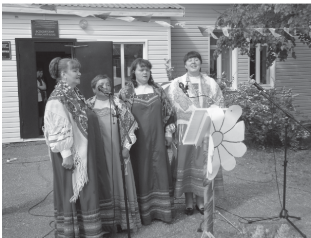
На фото: ансамбль «Яблонька» Всехсвятского сельского клуба

2 июня этого года был добрым и счастливым для жителей и гостей Всехсвятского, потому что у нашего села был день рождения.