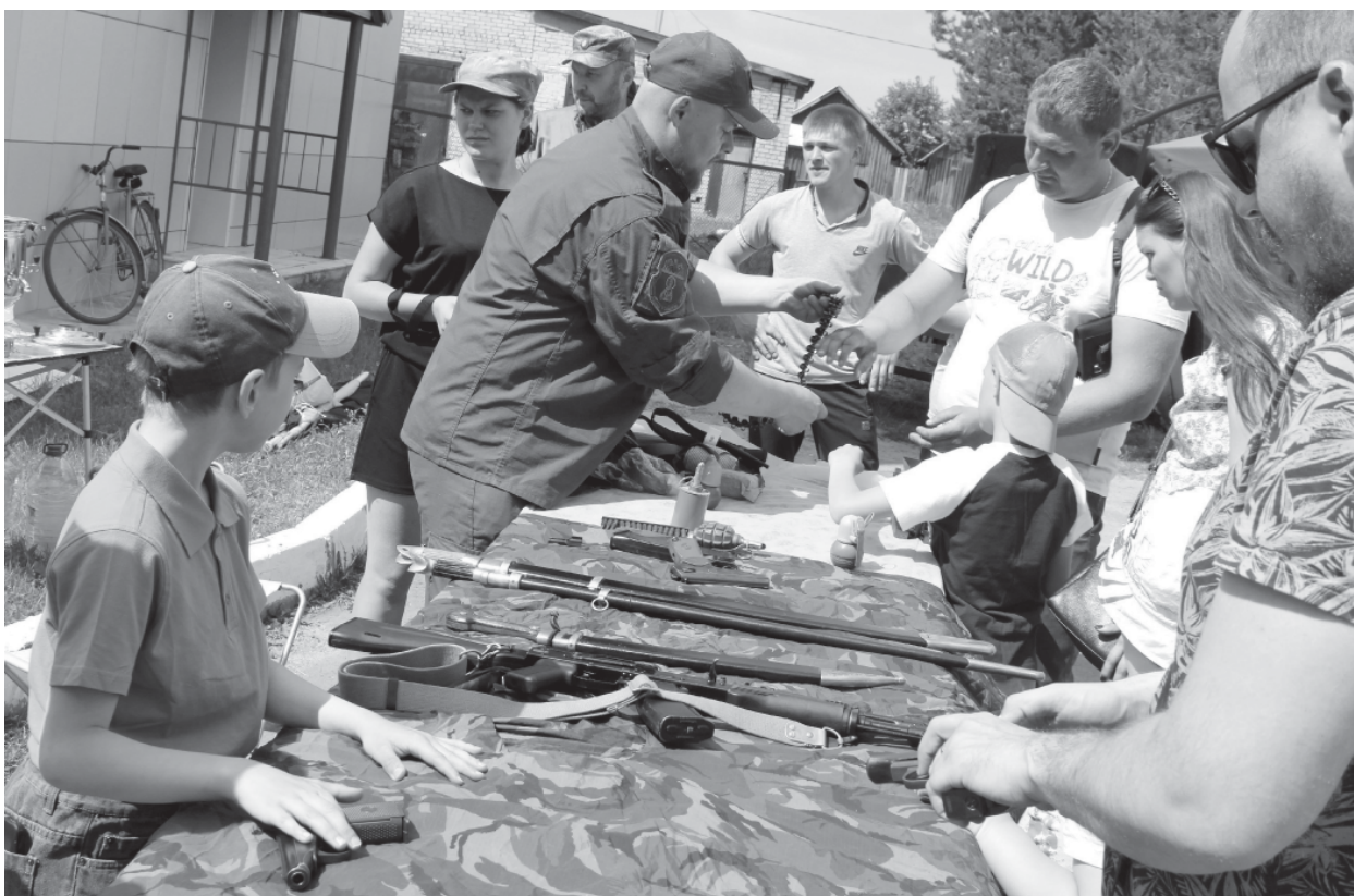
На фото: мастер-класс от казачьего общества «Русское» (Кузнецкинское сельское поселение)

17 июня в Первомайском районе прошел первый областной Форум отцов «Территория отцовства»