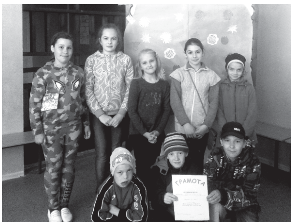
На фото: участники мероприятия посвященного Дню защиты детей

1 июня в 11.00 в Кукобойском доме культуры состоялась квест-игра «Краски лета»