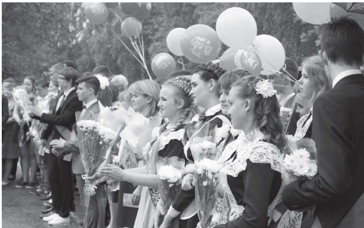
На фото: Последний звонок-2018 в Пречистенской средней школе

24-25 мая в школах Первомайского района прошли мероприятия, посвященные Последнему звонку