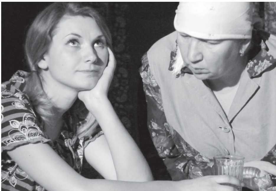
На фото: сцена из спектакля

25 мая прошла долгожданная премьера спектакля, а точнее генеральная репетиция перед самыми близкими и родными участников актерской труппы Пречистенского народного театра