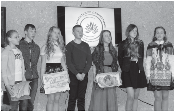
На фото: агитбригада Погорельской основной школы «Родничок»

В четверг, 5 апреля, интернет-кафе Первомайского МДК заполнили детские голоса. Здесь прошел 6 районный экологический фестиваль, который в этом году был приурочен к 100-летию юннатского движения в России