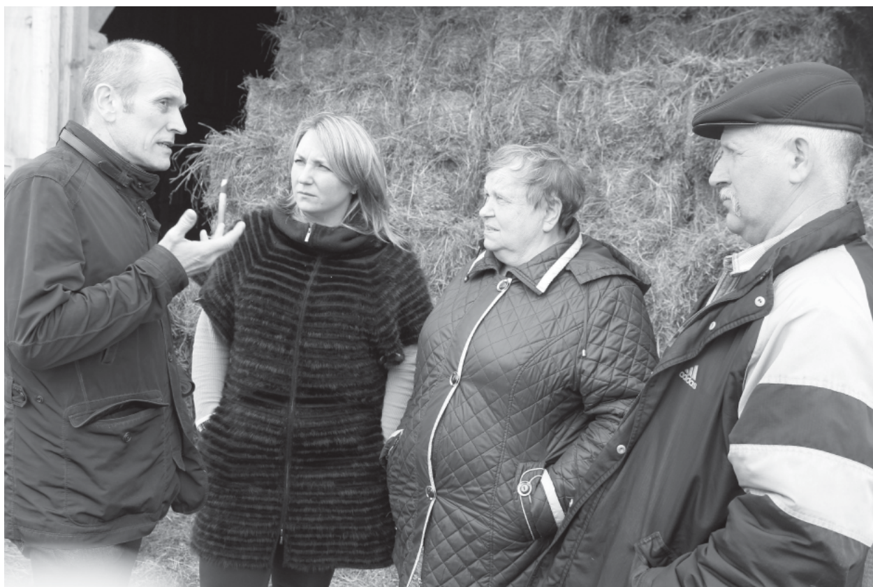
На фото: обсуждение перспектив развития возрождающегося ООО «Маяк»