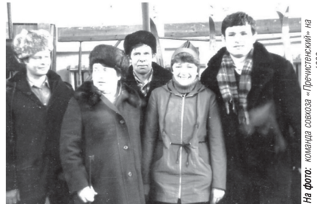
На фото: команда совхоза «Пречистенский» на соревнованиях по лыжным гонкам, 1986 год