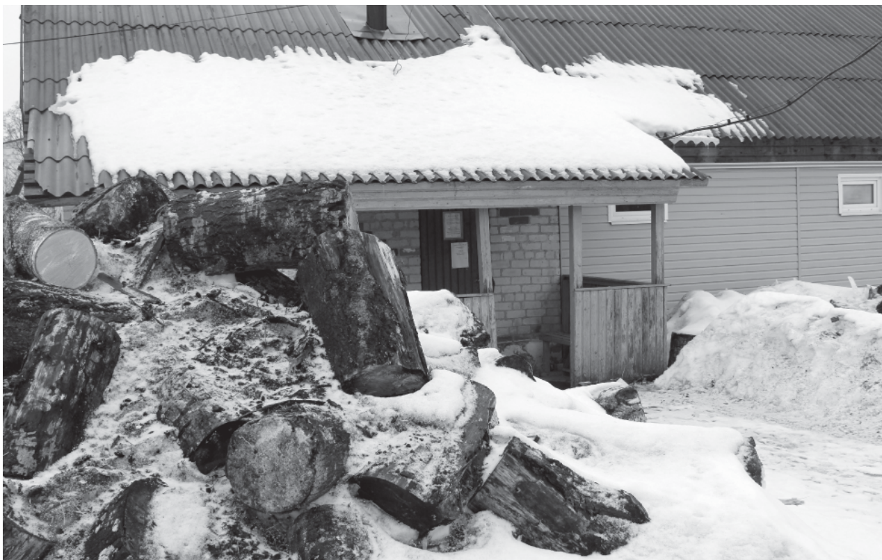
На фото: двери бани №2 п. Пречистое на замке