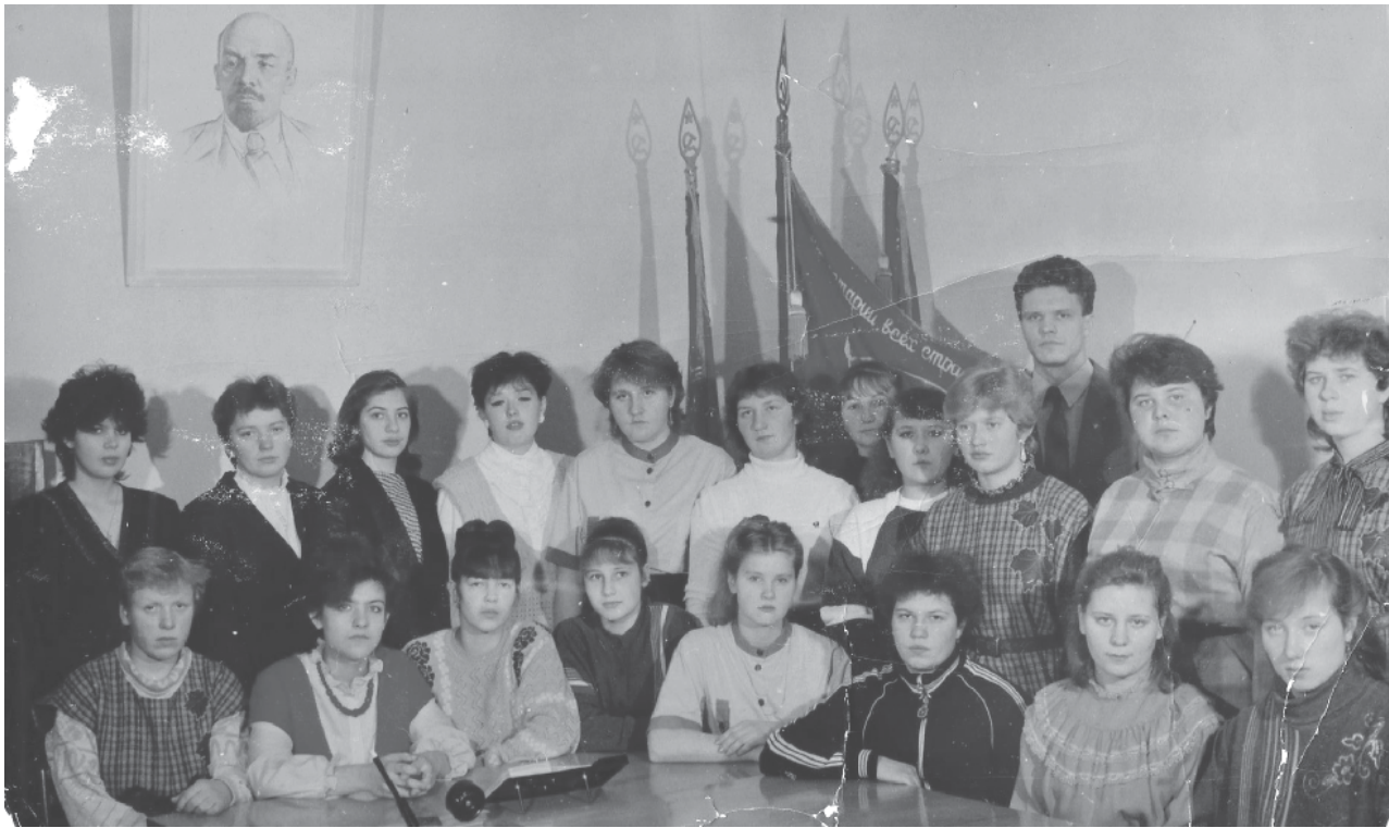
На фото: слет СКМОЖевцев, 1987 год

Весной 1987 года мне довелось побывать на центральной ферме совхоза «Пречистенский». На ней в ту пору работал сводный комсомольско-молодежный отряд животноводов (СКМОЖ). К тому времени выпускницы Пречистенской средней школы 1986 года уже полностью овладели азами машинного доения и справлялись с порученным делом вовсе не хуже опытных животноводов.