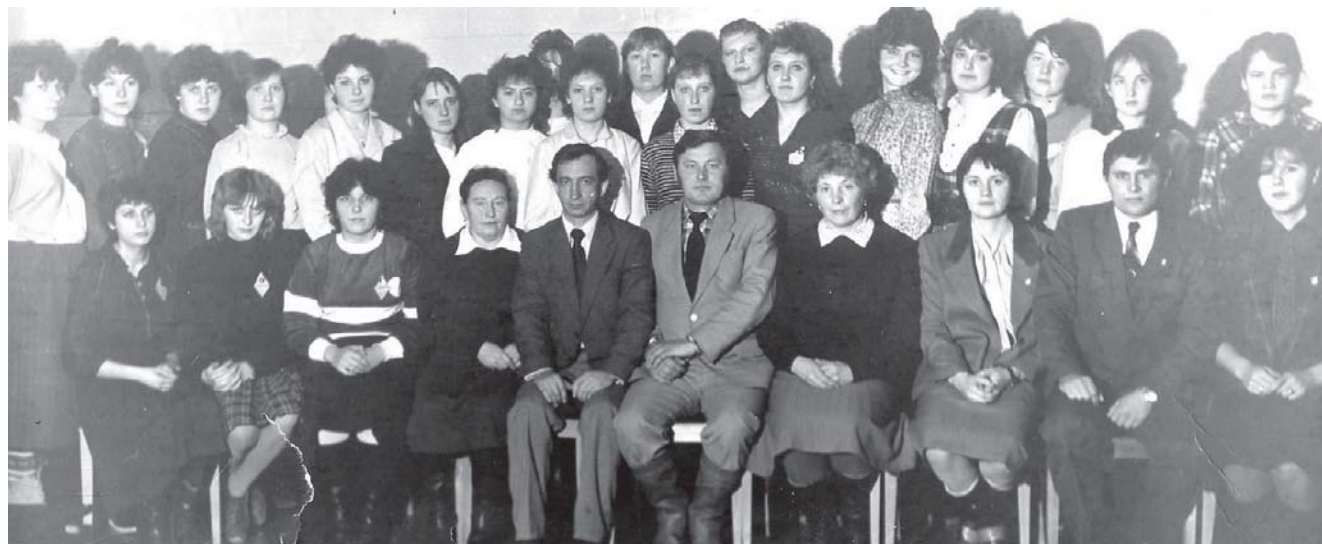
На фото: СКМОЖ совхоза «Пречистенский», 1982-1986 гг.