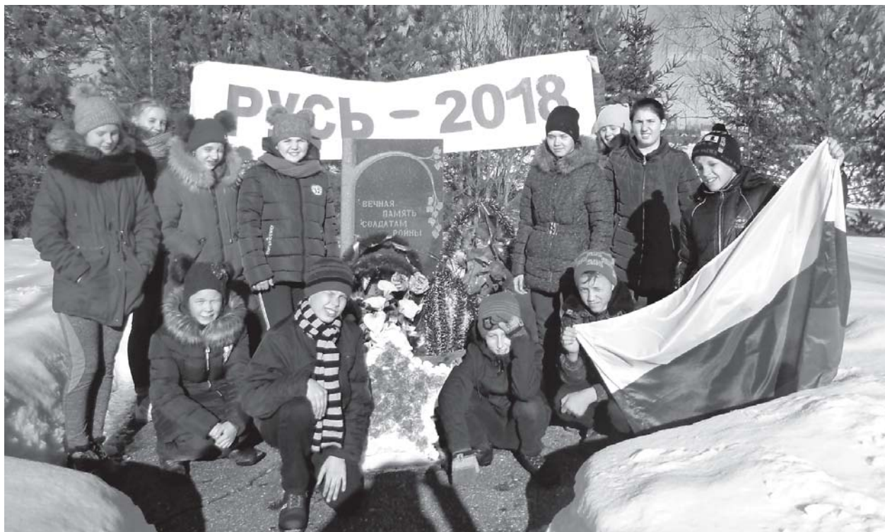
На фото: ученики Скалинской школы на маршруте «Русь-2018»

23 марта учениками Скалинской школы пройден последний маршрут региональной военно-патриотической акции «Лыжный пробег «Русь-2018», посвященной 75-й годовщине разгрома немецко-фашистских войск в Сталинградской битве