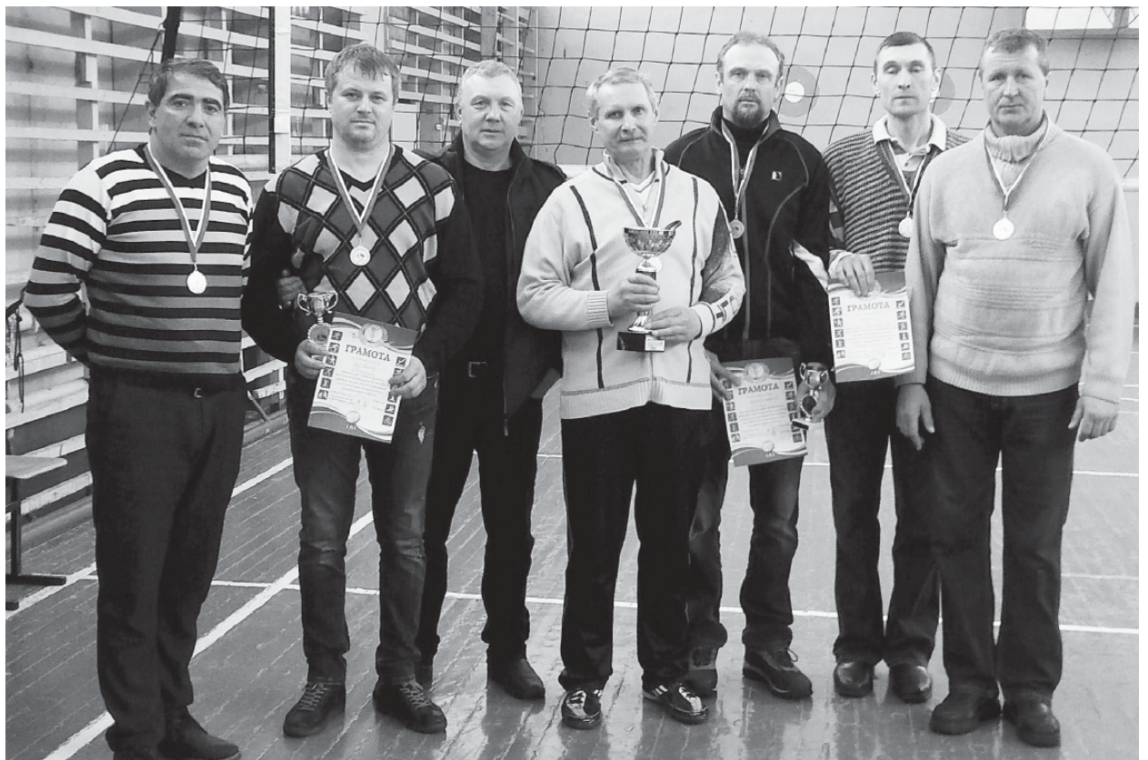
На фото: победитель Кубка Главы Пошехонского муниципального района - команда ветеранов волейбола «Пречистое»

В минувшее воскресенье, 25 марта 2018 года, в городе Пошехонье состоялся межрайонный турнир по волейболу среди мужских команд ветеранов на Кубок Главы Пошехонского муниципального района