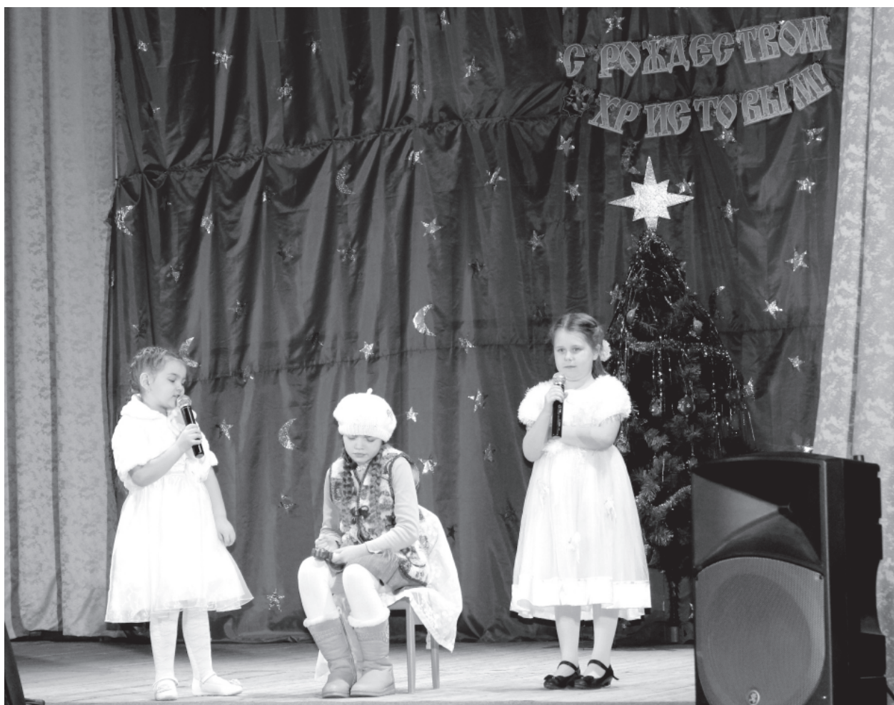
На фото: рождественская сказка в Кукобое

7 января всё село Кукобой собралось в Доме культуры, где уже несколько лет проходит большая концертная программа, посвящённая одному из самых значимых христианских праздников – Рождеству Христову.