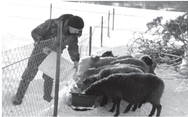
На фото: на водопое

в ближайшей перспективе количество земли увеличится, то и зерновые воз-