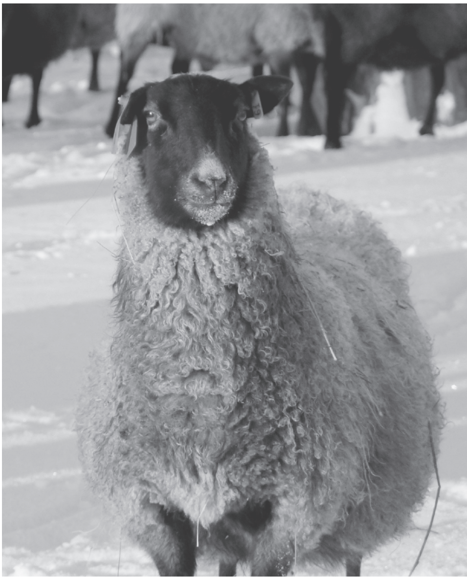
На фото: романовская порода овец - гордость ООО «Юрьевское»