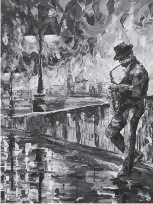
На фото: одна из картин Светланы Широкой

С 1 по 26 февраля в Первомайской централизованной Межпоселенческой библиотечной системе проходит выставка художественного творчества «Музыка моей души».