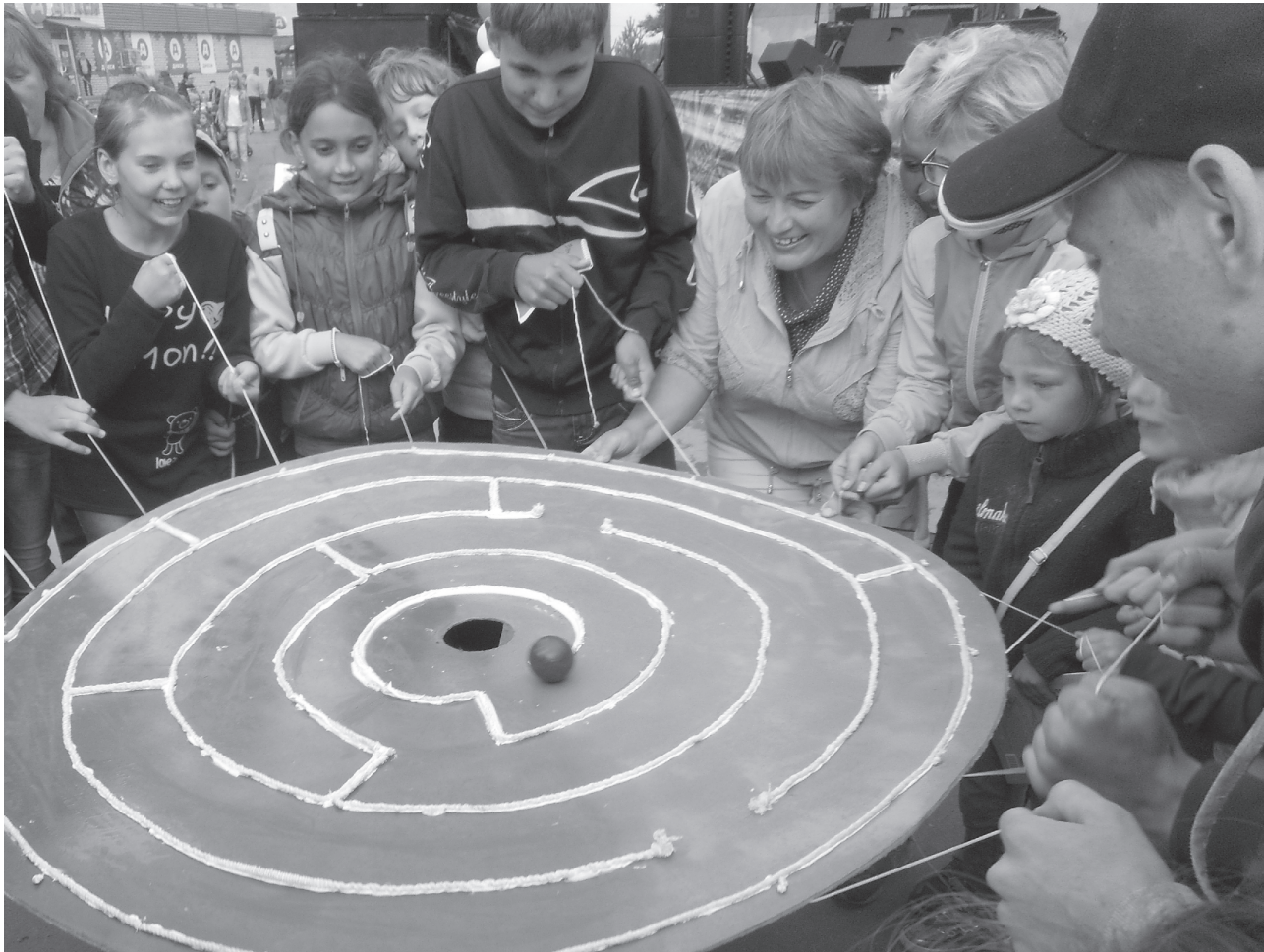
На фото: всем миром загоняли пречистенцы «вишню» в домик

26 августа состоялось празднование долгожданного Дня п. Пречистое. Специалисты муниципального учреждения «Агентство по делам молодёжи» порадовали молодёжь конкурсno-развлекательной программой «Яркое путешествие по Золотому кольцу», направленной на мотивацию здорового образа жизни.