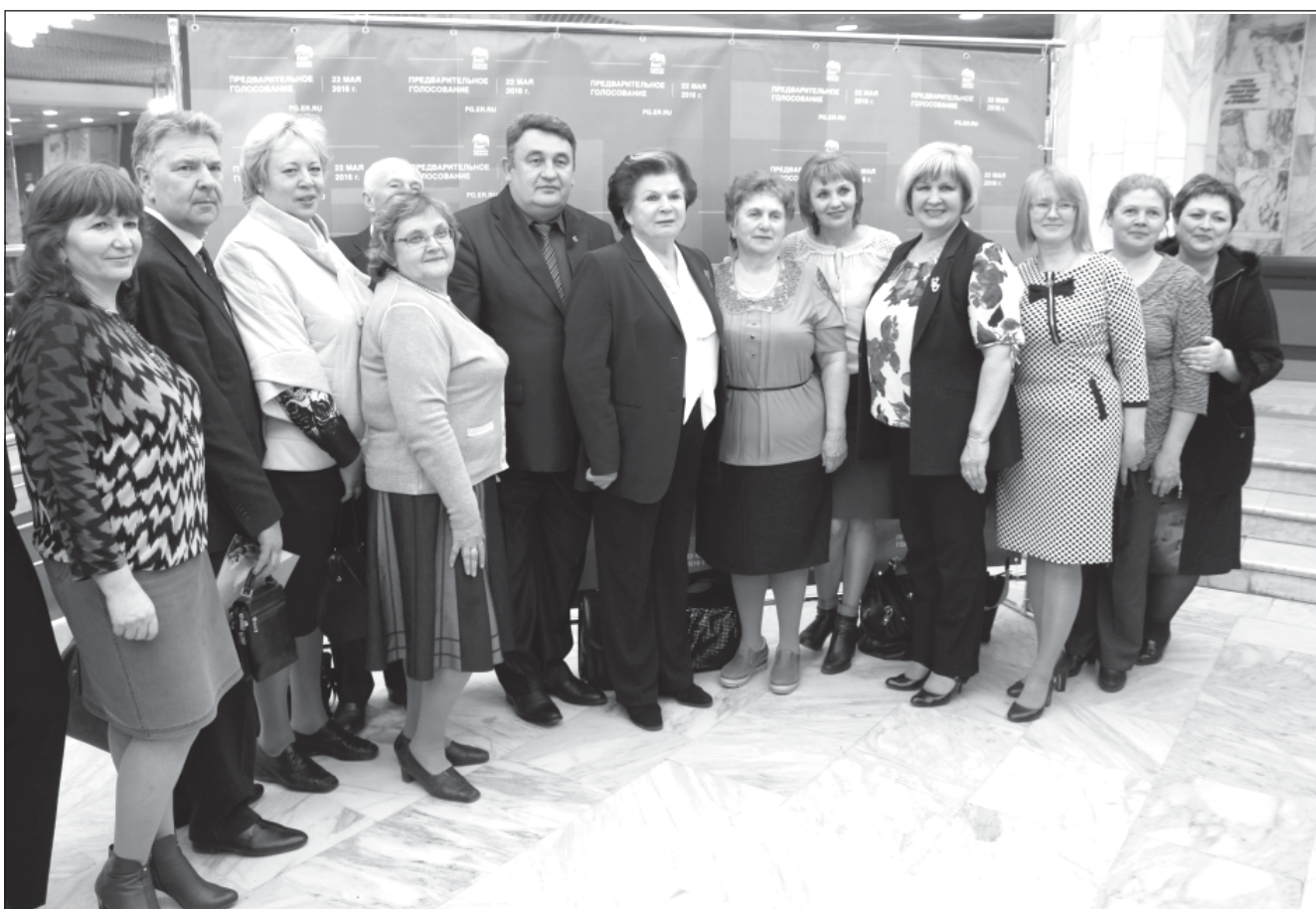
Первая женщина-космонавт, Герой Советского Союза, депутат Государственной Думы Валентина Владимировна Терешкова 27 апреля встретила с жителями Ярославской области.

Встреча проходила в Ярославле в ДК им. Добрынина в рамках Форума-дебатов участников предварительного народного голосования по определению кандидатов в депутаты Государственной Думы РФ от Ярославской области.