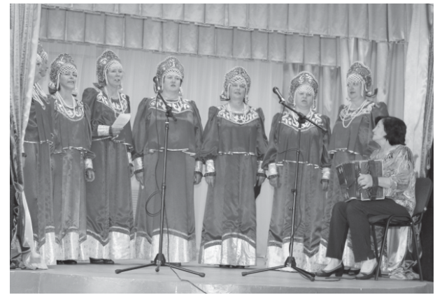
На фото: Игнатцевский народный хор