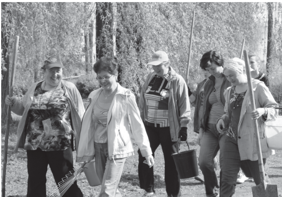
На фото: всем миром на субботнике!

В последнее время в старом парке посёлка Пречистое, что расположен за музеем леса и краеведения, становится все многолюднее. Нет, здесь пока еще не проводятся праздники. Но именно для того, чтобы в недалеком будущем некогда любимое пречистенцами место отдыха было снова востребовано, и приходят сюда