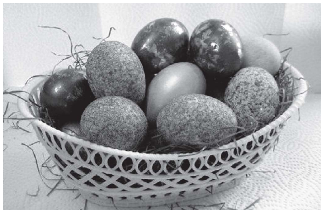
Этот день — конец Великого Поста. Верующие устраивают настоящий праздник живота, накрывая стол разнообразными блюдами. И конечно же, главные герои этого пира — крашенные яйца.

Пасха — святейший праздник всех христиан. В этот день принято ходить в гости к друзьям, близким и соседям со словами: «Христос Воскрес!». В ответ на это вас ждёт пасхальное приветствие: «Воистину Воскрес!». Внеся в дом эту радостную весть, вы непременно будете приглашены за стол, где вас угостят самыми лучшими кушаньями.