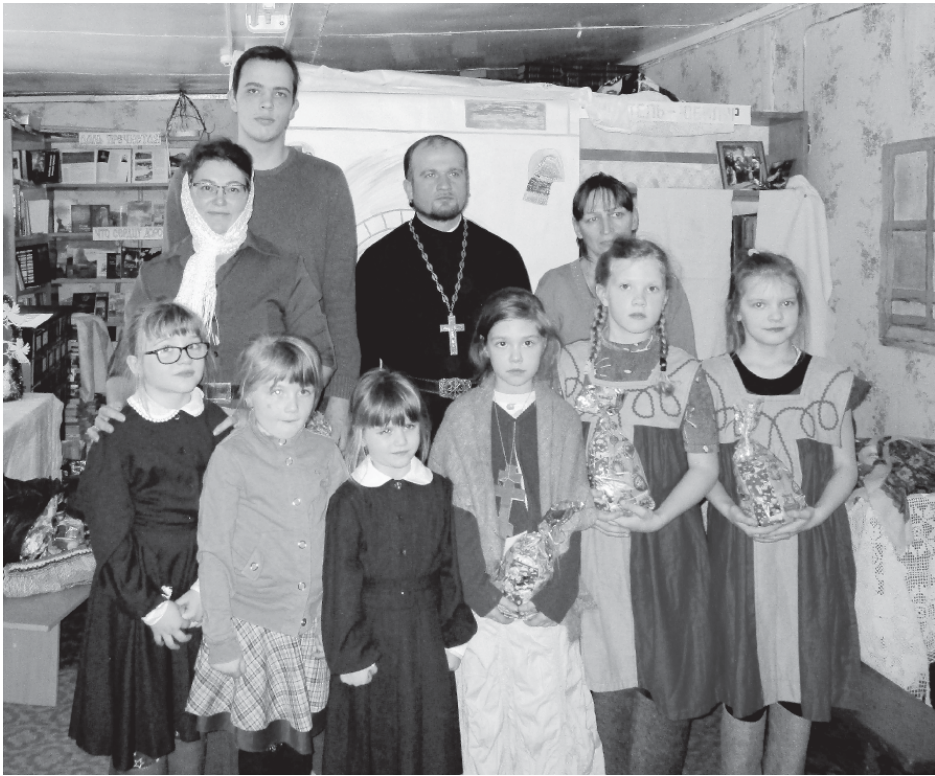
На фото: Рождество в Николо-Горской библиотеке

Седьмого января православные христиане встретили светлый праздник Рождества Христова