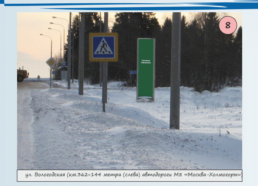
Схема размещения рекламных конструкций в г.п. Пречистое № 7, № 8, № 9